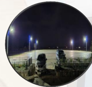
“Филипс гэрэлтүүлэг” ХХК

Сумын төвийн гэрэлтүүлэгийн толгой солих, туузан гэрэлтүүлэг суурилуулах ажил /3,563,000/ төг