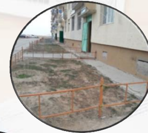
“Оч хийц” ХХК

154, 152 дугаар байрнуудын гадна ногоон байгууламжийн хашаа хайс нийлүүлэх ажил /6,500,000/ төг