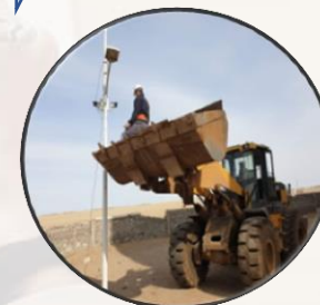
“Анлимитэд спийд солюшн” ХХК

Сумын төвийн гадна камер засварлах ажил /363,000/төгрөг